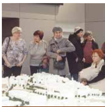
Centrum rozvoje Brna