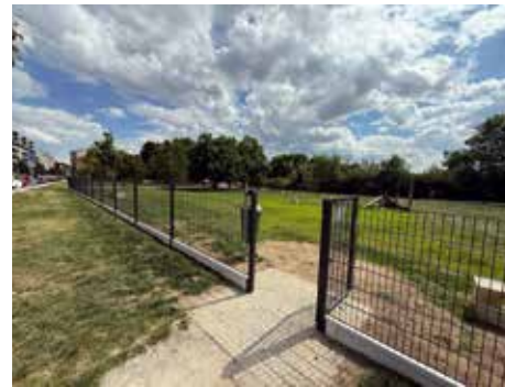
Psí výběh na Krásného je už otevřen.

Málokdy mi v mém sloupku zbyde místo na fotografie, takže jsem se tentokrát rozhodla to napravit. Jak se totiž říká, jeden obraz vydá za tisíc slov.