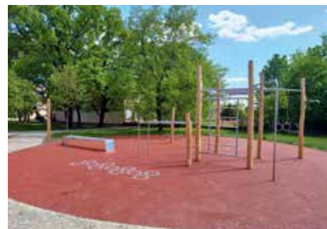
Nové workoutové hřiště na Krásného už je k dispozici dospělým i dětem.