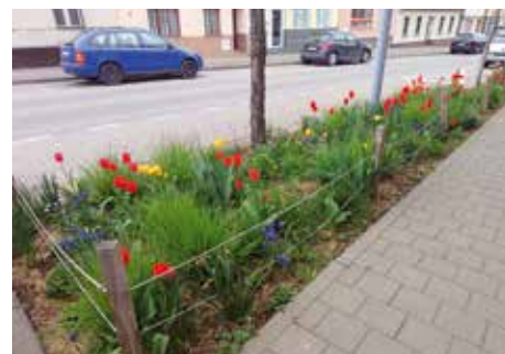
Rozkvetlé trvalkové záhony na Jamborově.