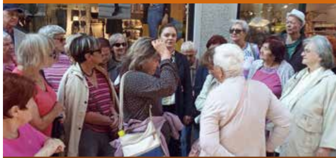
19.9. - Komentovaná procházka Brnem za funkcionalistickými stavbami